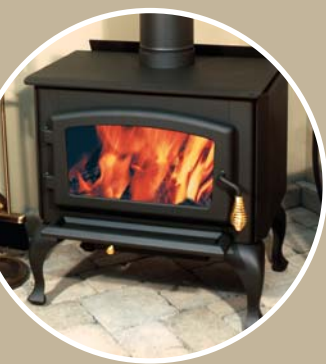
Cast iron legs and door Pattes et porte en fonte