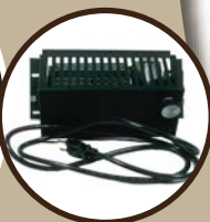
Blower / Ventilateur