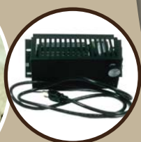
Blower / Ventilateur