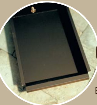
Ash pan Tiroir à cendre